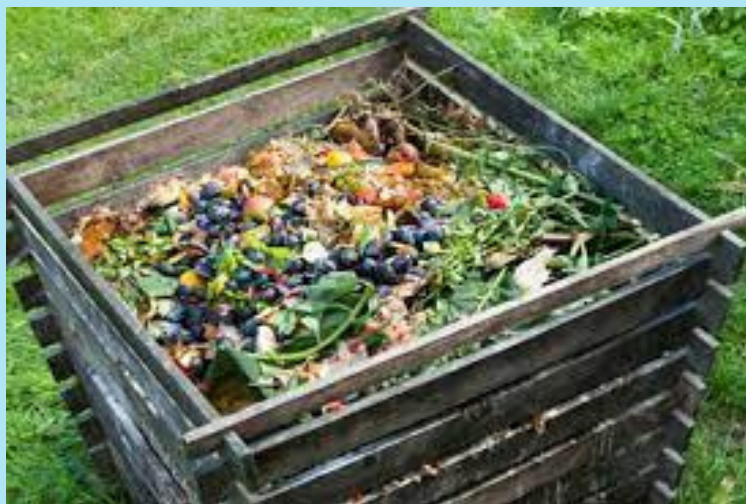
D.R. photo d'illustration

Vrai. Selon l'Ademe, 254kg d'ordure ménagère sont jetés chaque année par les Français. Les biodéchets représentent un tiers de ce total, soit 83 kg. En enlevant les déchets verts (pelouse et autres végétaux), ce sont encore 67 kg de déchets alimentaires qui sont jetés dans nos poubelles. Aujourd'hui, elles sont incinérées ou enfouies.