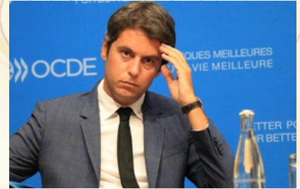
photo d'illustration

comme il l'a annoncé mercredi 6 décembre sur franceinfo. Cet essai doit durer deux ans dans les écoles, collèges et lycées français où les collectivités se portent volontaires. Si Gabriel Attal doit détailler les contours de cette expérimentation, franceinfo en a déjà dévoilé les grandes lignes ce lundi 11 décembre 2023.