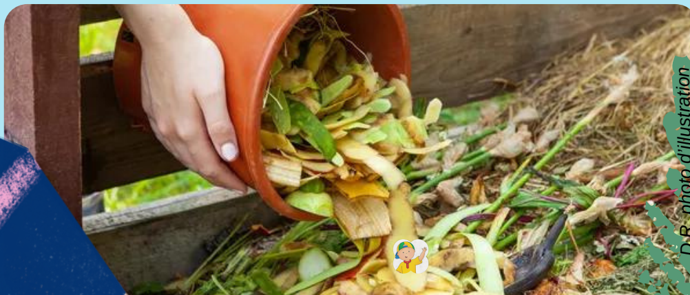
D.R. photo d'illustration

Selon les chiffres de l'Ademe, 20 millions de Français seront équipés d'une solution dès le 1er janvier 2024.