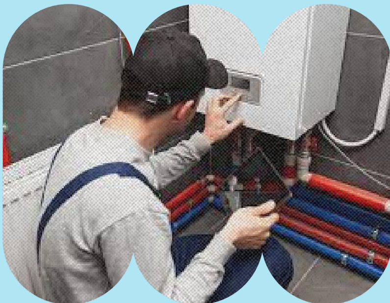
photo d'illustration