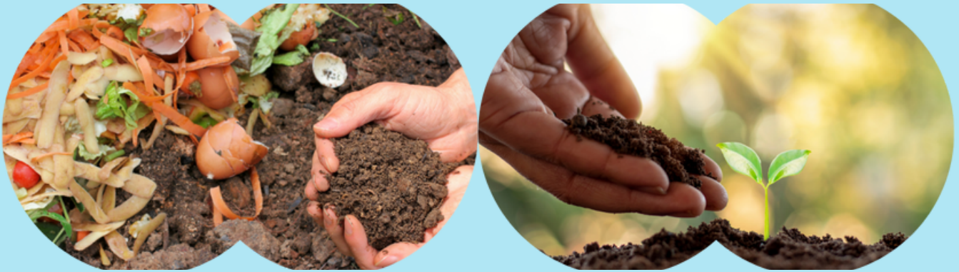
D.R. photo d'illustration

Le compostage est la décomposition des déchets de cuisine et de jardin en compost. C'est un phénomène 100% naturel qui permet à la fois de réduire ses déchets et de bénéficier d'un fertilisant pour les sols et les plantes. C'est simple et économique !