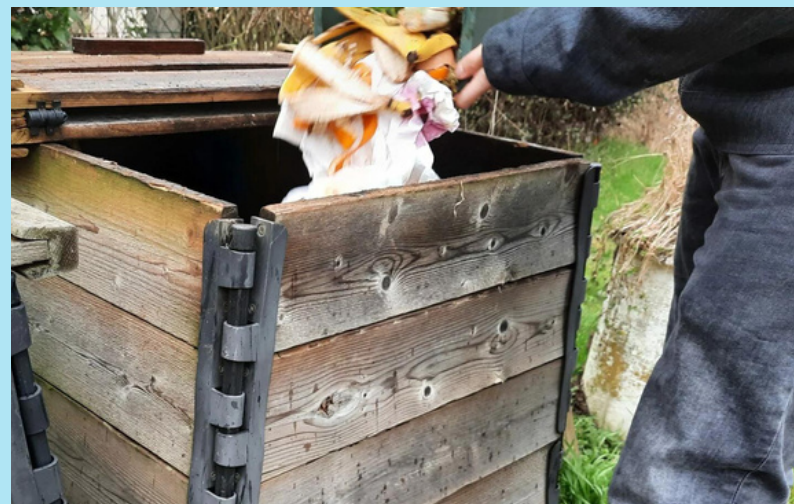
photo d'illustration