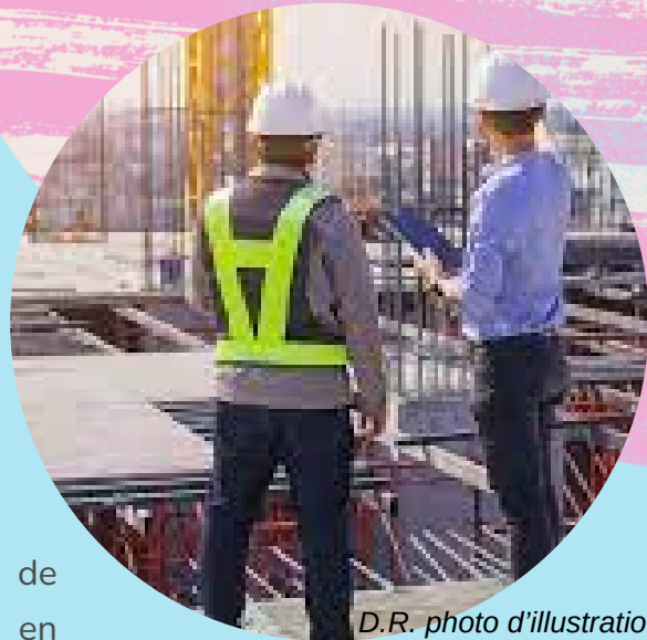
D.R. photo d'illustration

2 ans pour préparer un BTS (bâtiment ; travaux publics) ; 3 ans pour le BUT génie civil-construction ou une licence professionnelle mention métiers du BTP (bâtiment et travaux publics).