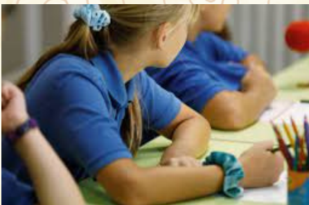
D.R. photo d'illustration

Pratiquement tous les établissements publics et privés auront leur uniforme, ou au moins un code vestimentaire strict. L'uniforme se portera de 4 à 16 ans ; dans la plupart des lycées, les élèves de 16 à 18 ans devront aussi porter l'uniforme ou se conformer à un code vestimentaire.